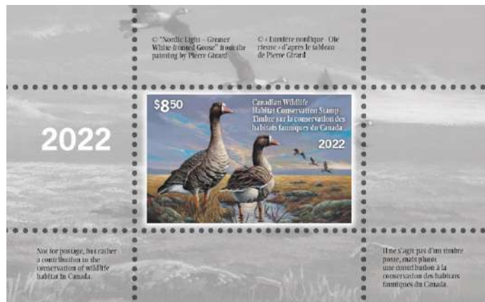
Feuillet du Timbre sur la conservation des habitats fauniques du Canada 2022 © Sa Majesté la Reine du chef du Canada, représentée par le ministre de l'Environnement, 2022.

Pour de nombreuses personnes, qu'il s'agisse d'adeptes de la chasse, de spécialistes de la conversation ou autre, le Timbre sur la conservation des habitats fauniques du Canada représente bien plus qu'une simple image. Bien qu'il soit apposé sur le permis de chasse aux oiseaux migrateurs considérés comme gibier, il est aussi un symbole de conservation et évoque le souvenir de saisons de chasse mémorables. À HFC, nous aimons savoir ce que le Timbre signifie pour les personnes qui nous soutiennent. Le Timbre d'HFC fait partie de votre collection ou figure sur un de vos anciens permis de chasse? Vous possédez un tirage de la lithographie? Peu importe votre lien avec l'image, faites-nous part de ce qu'elle représente pour vous en utilisant le mot-clic #RôleduTimbreHFC dans les médias sociaux.