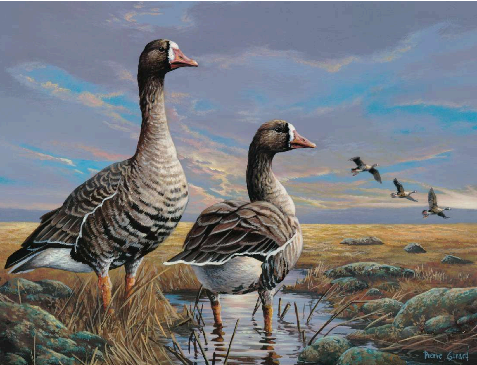
Image du Timbre et de la lithographie sur la conservation des habitats fauniques du Canada de 2022 : Nordic Light - White Fronted Goose par Pierre Girard.