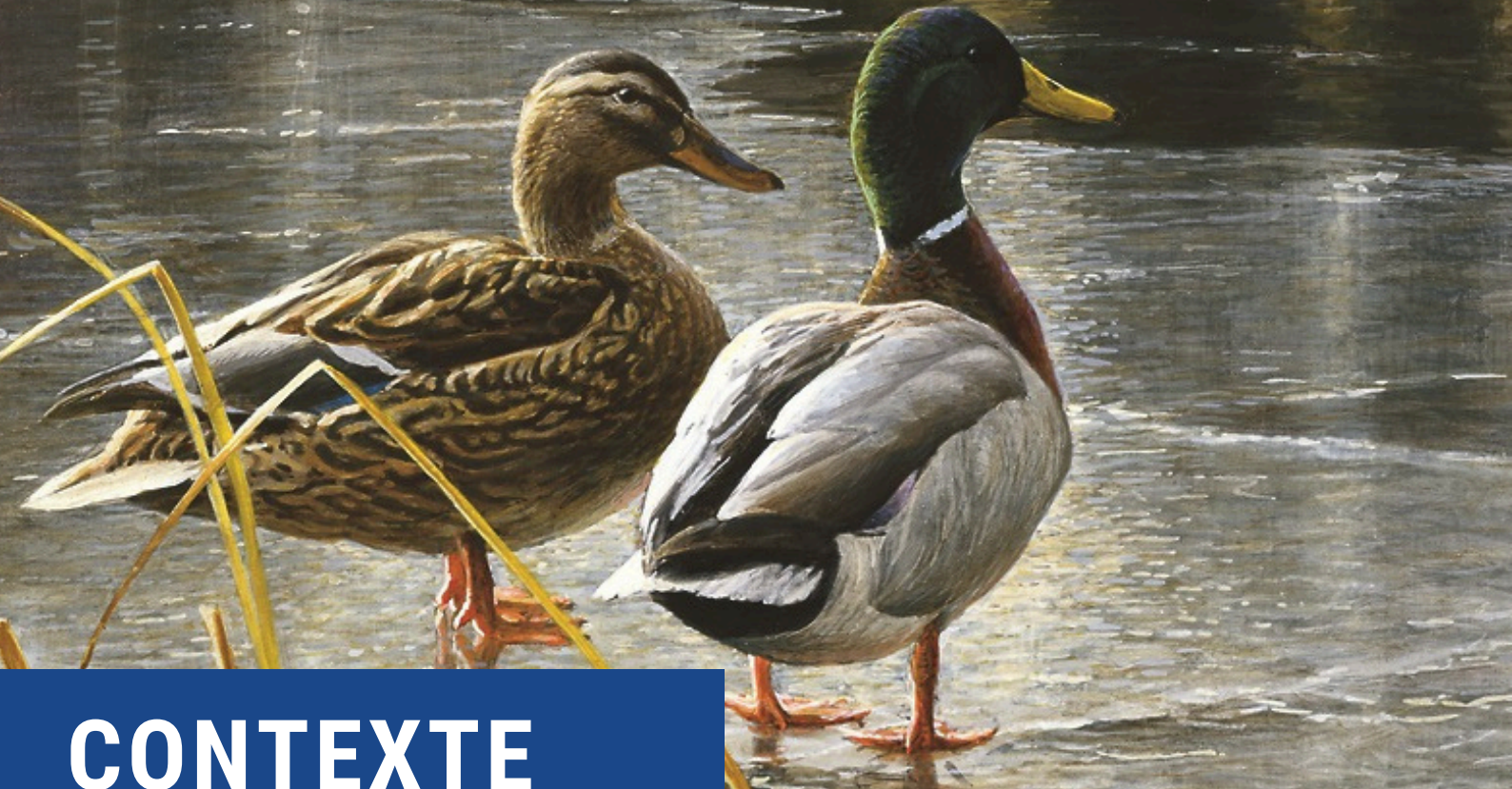
« Couple de mallard - Début d'hiver » La peinture inaugurale en 1985 par Robert Bateman