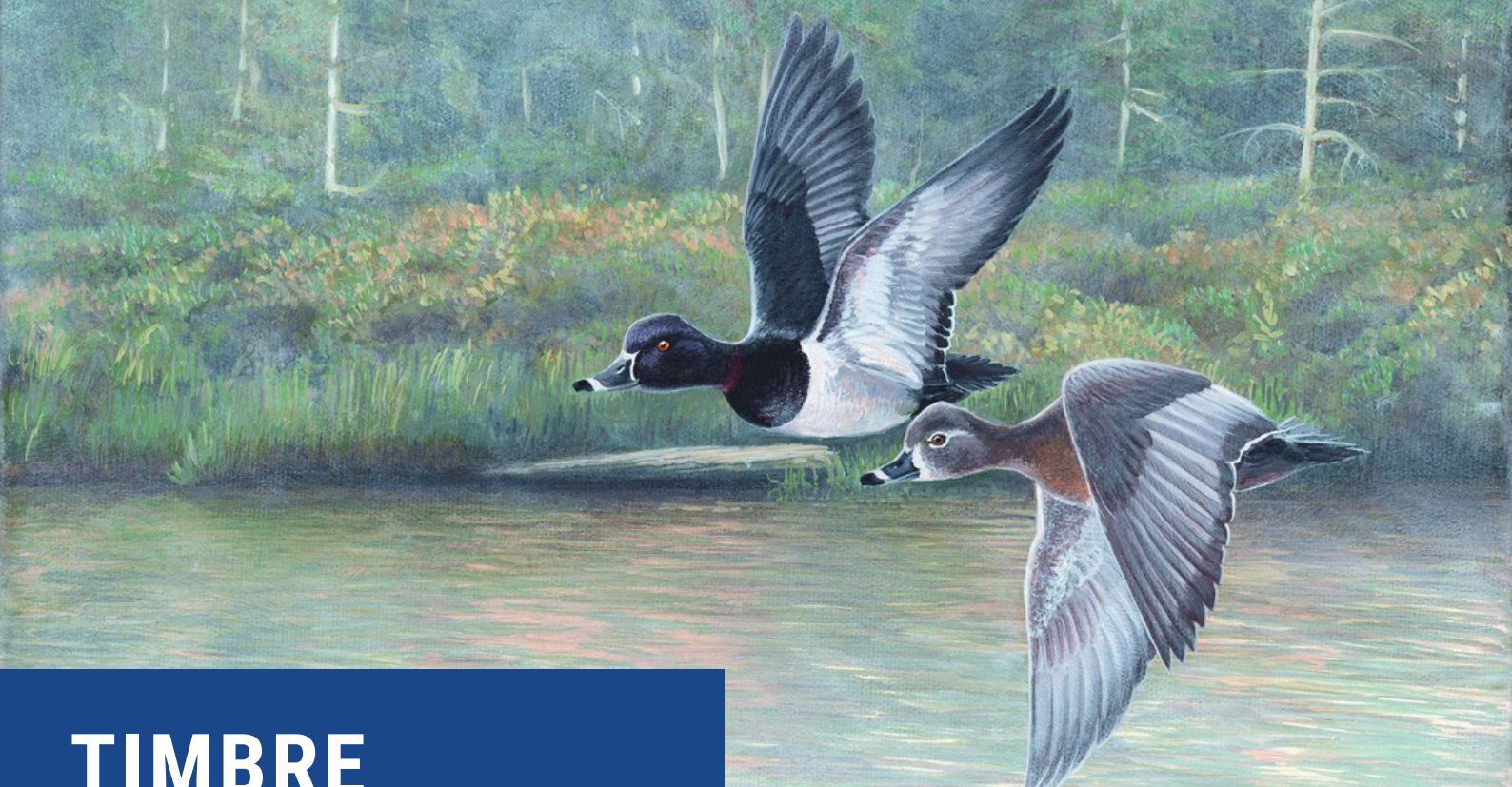
2023 Timbre sur la conservation : « Brème boréale - Fuligules à collier »