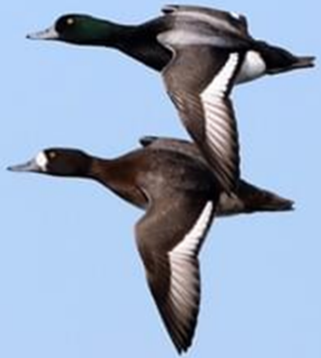
Mâle et femelle en vol : Fuligule milouinan