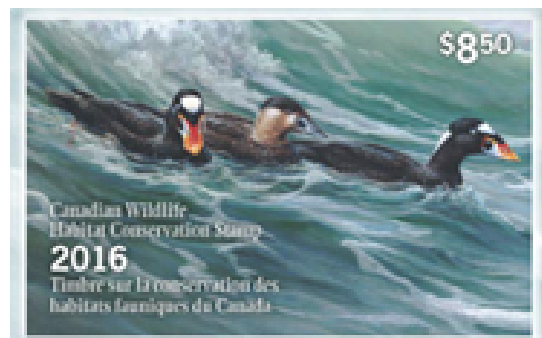
Image originale gagnante de 2016