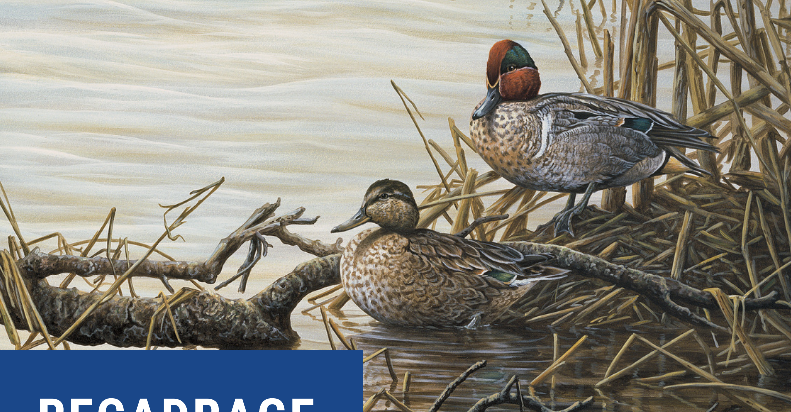
Image de l'œuvre lauréate du concours d'art HFC 2010 – « Printemps au marais – Sarcelle d'hiver » par Pierre Girard