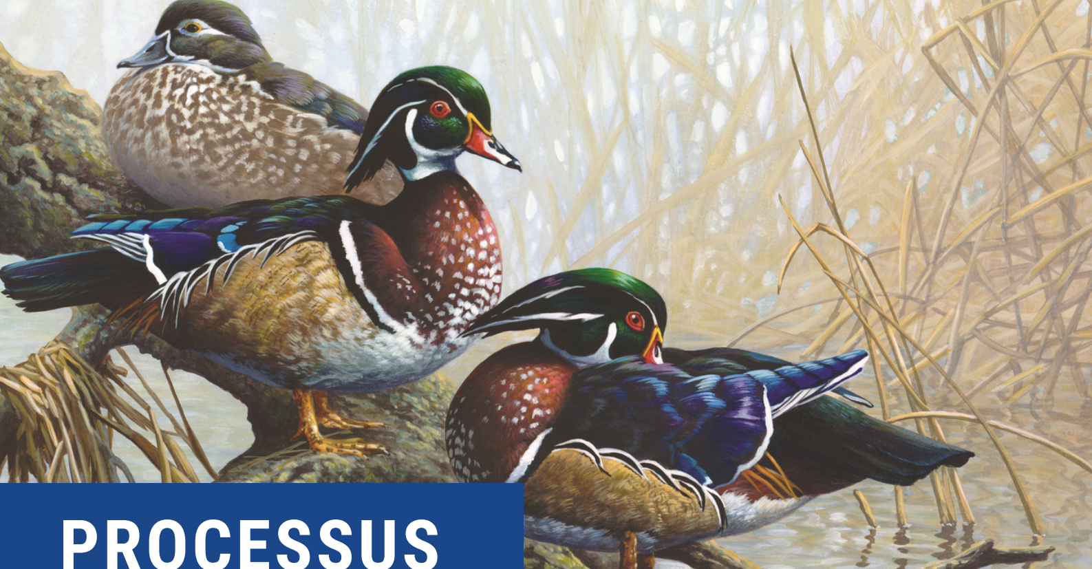
Image de l'œuvre lauréate du concours d'art HFC 2018 – « Teintes d'automne – Canard branchu » par Pierre Girard