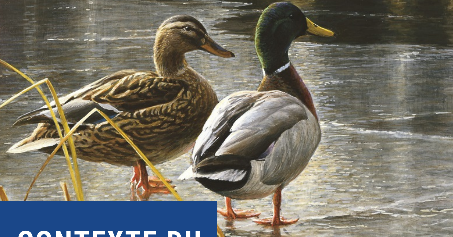
La peinture inaugurale en 1985 par Robert Bateman « Couple de malards – Début d'hiver »