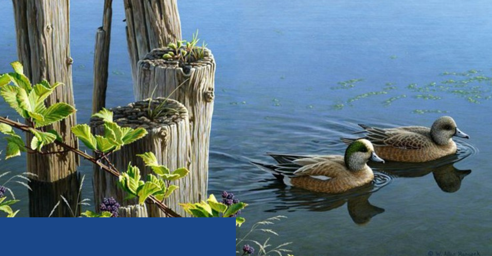
Image de l'oeuvre lauréate du concours d'art HFC 2011 - « Près du rivage – Canard d'Amérique » par W. Allan Hancock