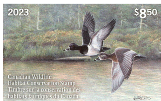
Image originale gagnante 2023