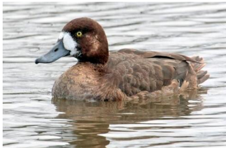
Femelle en plumage nuptial : Fuligule milouinan