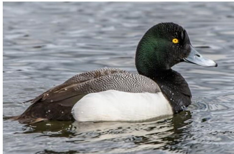
Mâle en plumage nuptial : Fuligule milouinan

Votre peinture doit présenter un habitat adéquat, réaliste et précis. Il faut donc que le caractère saisonnier et la verdure correspondent à la période de l'année que vous souhaitez représenter. Veuillez ne pas inclure d'espèces végétales envahissantes.